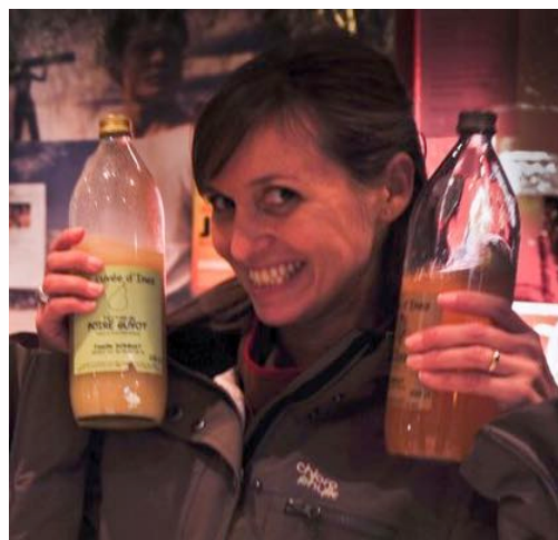
Louisianne, en transition à Salon

Après un an d'investissement, 230 personnes aiment la page Facebook du Pays Salonais en Transition . Bien, mais cela pourrait être beaucoup plus ! Alors, n'hésitez pas à suivre la page (pas besoin d'avoir un compte Facebook pour la consulter), partager les messages... et inviter vos amis à l'aimer ! C'est ainsi que nous pourrions faire connaître nos actions de manière encore plus large, et donner à tout un chacun envie d'y participer... Likez-nous ! Merci pour votre aide !